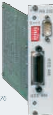
Option 72 & 76