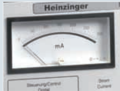
Option 03 analog display