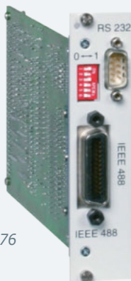
Option 72 & 76