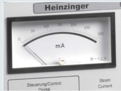
Option 03 analog display